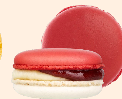
Земляника в сливках