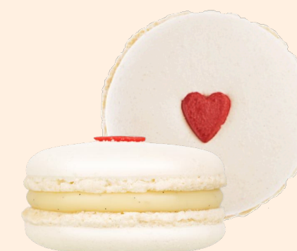
Ваниль с сердцем