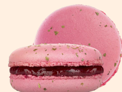
Малина с базиликом