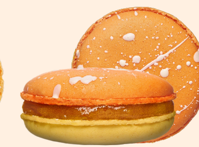
Манго-маракуйя с центром кокос-чия