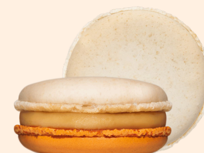
Кленовый сироп с грильяжем