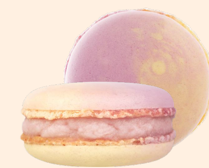
Лаванда с лимоном