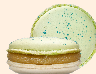
Карамельная груша с горгонзоллой