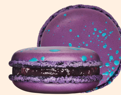
Голубой сыр с виноградом