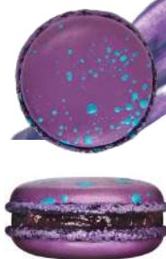
Голубой сыр с виноградом