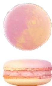
Лаванда с лимоном