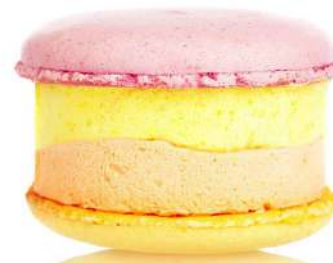
Манго – Маракуйя