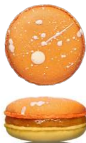
Манго-маракуйя с центром кокос-чия