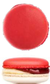
Земляника в сливках