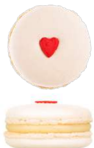
Ваниль с сердцем