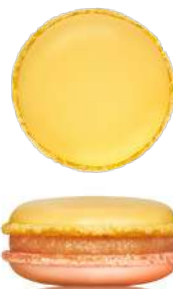
Ананасы в шампанском с кокосовым кремом