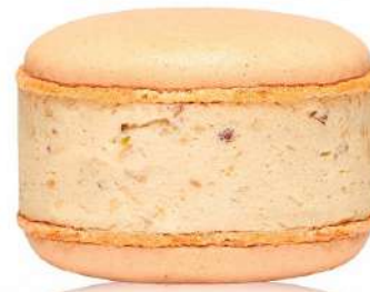
Крем-брюле с орешками