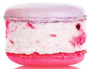
Ягодный смузи с маршмеллоу