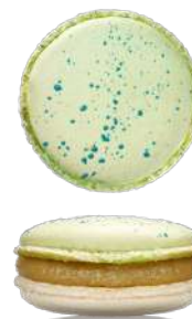
Карамельная груша с горгонзолой