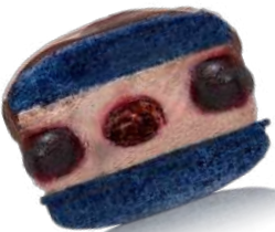
Сникерс с соленой карамелью