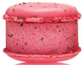
Малина с базиликом