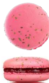
Малина с базиликом